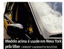
Modelo acima é usado em Nova York pelo Uber

Decreto de regulamentação publicado pela prefeitura prevê identificação dos veículos PÁG. 02