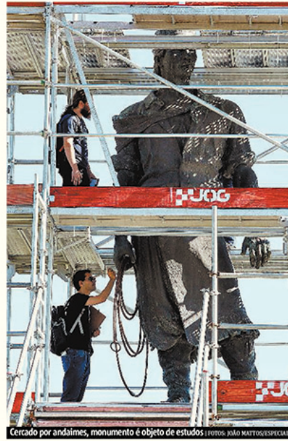
Cercado por andaimes, monumento é objeto de estudos