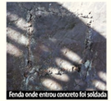
Fenda onde entrou concreto foi soldada