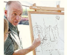
Amarger explicou o caso em desenho