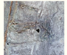
Fissuras afetam a base da estátua