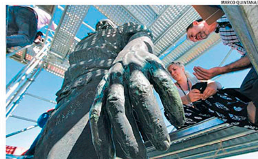
Diagnóstico da situação deve se estender até o fim desta semana

Dois especialistas em restauro de obras com metal foram contratados para a avaliação. Como forma de aproveitar a presença desses profissionais, um ateliê-escola está sendo realizado, com 15 participantes do País. O objetivo é formar profissionais capazes de atuar em futuras intervenções do tipo.